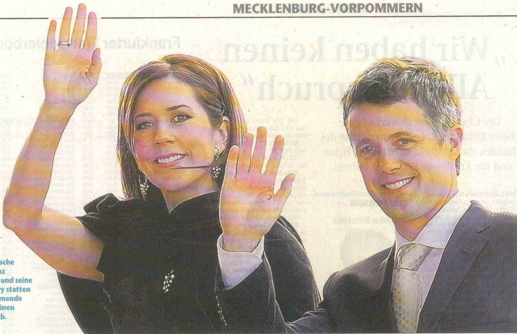
Der dänische Kronprinz Frederik und seine Frau Mary statten MV kommende Woche einen Besuch ab.